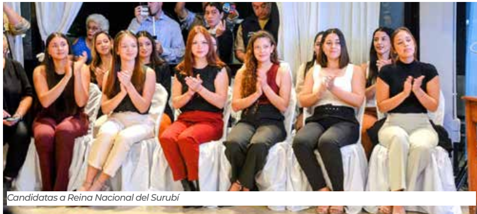
Candidatas a Reina Nacional del Surubí

compositora y actriz argentina. Saltó a la fama por sus canciones “Butakera”, “Tu amor” y “Dos besitos”, temas que estarán seguramente en el repertorio que brindará al público de Goya.