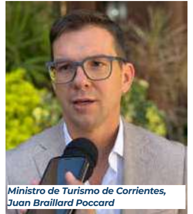
Ministro de Turismo de Corrientes, Juan Braillard Pocard

El funcionario provincial destacó el impacto internacional del evento, el trabajo conjunto con el municipio y el potencial de la Reserva Isoró como nuevo polo turístico. "Venimos trabajando muy bien con el Municipio y la COMUPE y deseando que, en vísperas de la boda de oro, esta 49° edición sea inolvidable", expresó a La Revista de la Fiesta